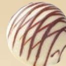
COLORADO Ref: 33305 Crème Irish Coffee Sahne mit Irish Coffee Cream Irish Coffee