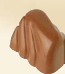
GAUGUIN Ref: 33108 Ganache framboise Himbeer-Ganache Raspberry ganache