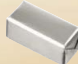
PASSION Ref: 33420 Gianduja noisettes Gianduja von Haselnüssen Hazelnut gianduja