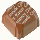
PLATO Ref: 33402 Praliné cannelle Zimt-Nougatcreme Cinnamon hazelnut cream