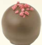
BOHÈME Ref: 33602 Crème au beurre framboise Himbeeren Buttercreme Smooth raspberry butter cream