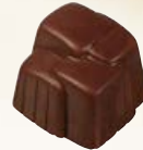
PASEO Ref: 33413 Praliné aux éclats de fèves de cacao Nougatcreme mit Kakaobohnenstückchen Hazelnut cream with cocoa nibs