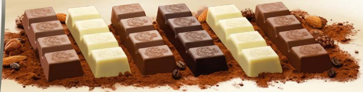
Chocolate bars 75g - Bâtons de chocolat 75g - Schokoladenriegel 75g