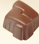
GUATEMALA Ref: 33103 Ganache orange avec écorces d'orange Apfelsinen-Ganache mit gehackten Orangetten Orange ganache with candied orange peel